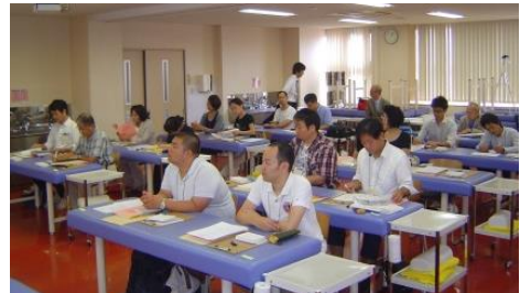
(昨年の臨床研風景)

【お問い合わせ・お申込み】 公益社団法人日本鍼灸師会 事務局 TEL 03-3985-6771