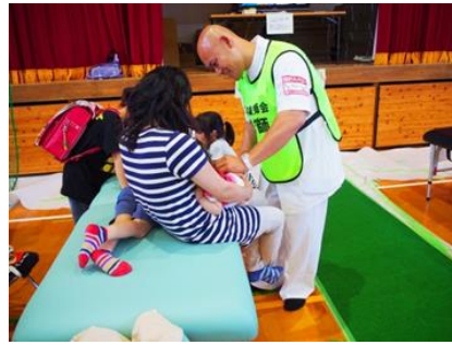
* 益城町・・・保健福祉センターはびねす (7月26日終了)