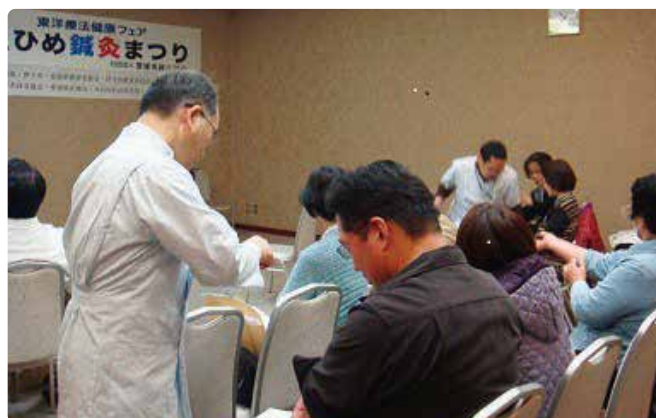
平成24年3月18日（日）に開催されました「えひめ鍼灸まつりin伊予」の様様です